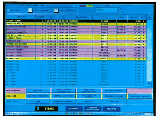
État des réservations.